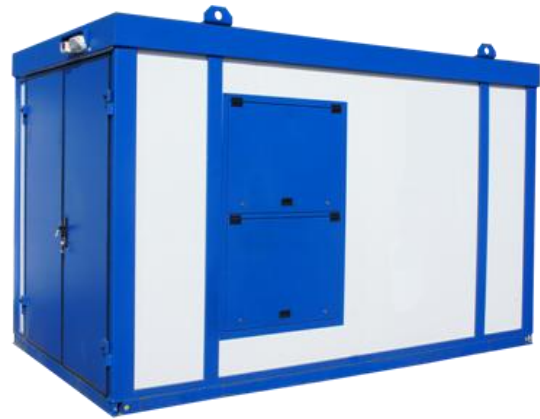
Дизельная электростанция в блок контейнере «Север»

Дизель-генераторные установки в зависимости от условий эксплуатации могут быть выполнены в следующих исполнениях: